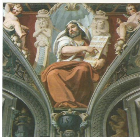
Prorok Izaija, hrvatska crkva sv. Jeronima u Rimu

Izaija – potječe iz ugledne obitelji u Jeruzalemu i djeluje u vrijeme kraljeva Ahaza (736. – 721.) i Ezekije (721. – 693.). U to su vrijeme Judeji prijetili Asirci, koji su već bili osvojili Sjeverno kraljevstvo. Izaija je ustajao protiv pokvarenosti koja je zahvatila Jeruzalem i Judeju, pozivao je na povjerenje i vjeru u Boga te navijestio dolazak novoga kralja, Emanuela (Bog s nama), što se ispunilo u Isusu Kristu. Izaija se odlikovao ljepotom izričaja i stila te je imao velik utjecaj na svoje sljedbenike. Cijela knjiga proroka Izaije pripisuje se njemu, iako su druga dva dijela kasnije napisali njegovi učenici: Drugi Izaija (pogl. 40 – 55) i Treći Izaija (pogl. 56 – 66).