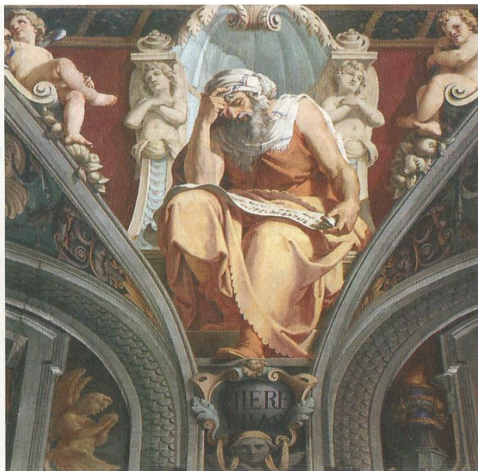
Prorok Jeremija, hrvatska crkva sv. Jeronima u Rimu

Jeremija – jedan od najvećih proroka Starog zavjeta. Potječe iz svećeničke obitelji iz okolice Jeruzalema, a kao prorok djelovao je u najtežem povijesnom razdoblju izraelskog naroda (625. – 587.), kad je babilonski kralj Nabukodonozor opsjedao Palestinu, osvojio Jeruzalem (597.) i konačno razorio grad i poslao Židove u progonstvo u Babilon (587.). U svojim se proročkim riječima zalagao za slobodu i vjersku obnovu naroda, ali ga je i optuživao zbog grijeha i bezbožnosti, zbog čega će ga zadesiti kazna propasti zemlje i progonstva u Babilon. Njegovi proročki govori bili su hrabri i otvoreni pa je doživljavao mnoge progone, mučenja i zatvaranja. Bio je patnik zbog istine, ali to ga nije pokolebalo. No Jeremija je i prorok nade. On naviješta povratak naroda u domovinu, ponovno očitovanje Božje ljubavi i skla-panje novoga Saveza između Boga i njegova naroda. To se proroštvo najpotpunije ostvarilo u Isusu Kristu.