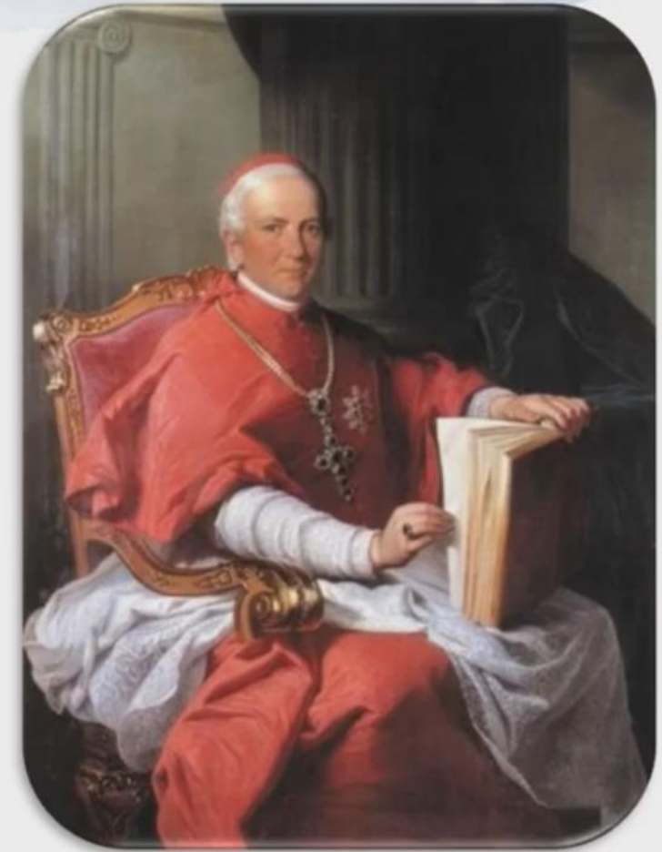
Juraj de Várallya, Juraj Haulik