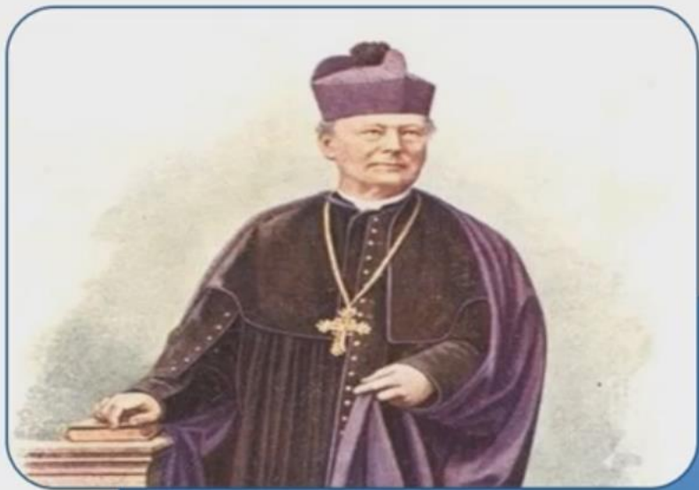
biskup Josip Juraj Strossmayer