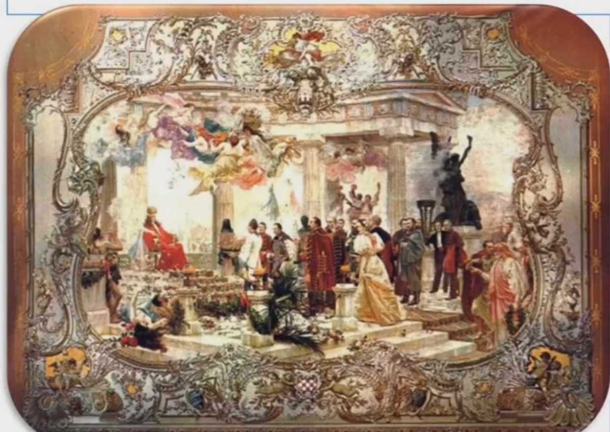
Vlaho Bukovac, Ilirski preporod (svecani zastor Hrvatskog narodnog kazalista u Zagrebu)