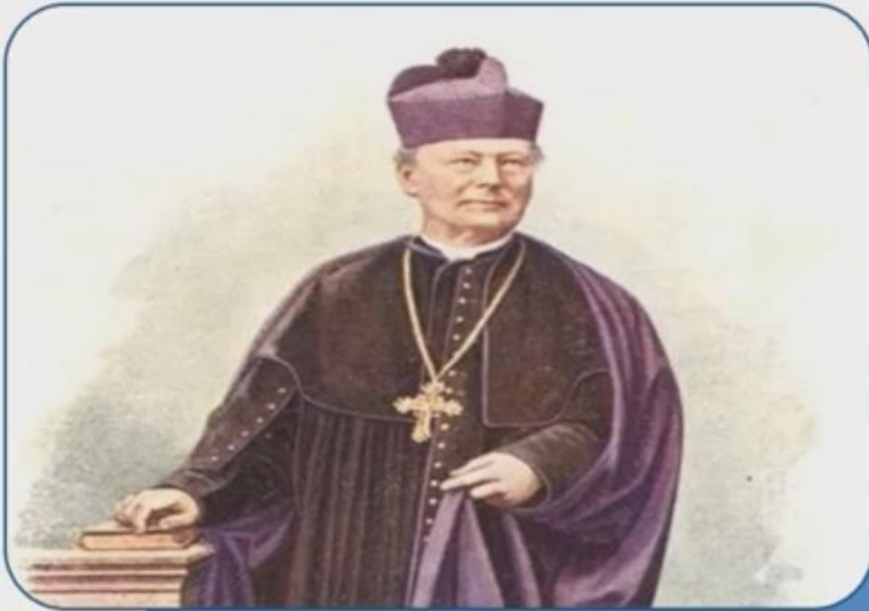
biskup Josip Juraj Strossmayer