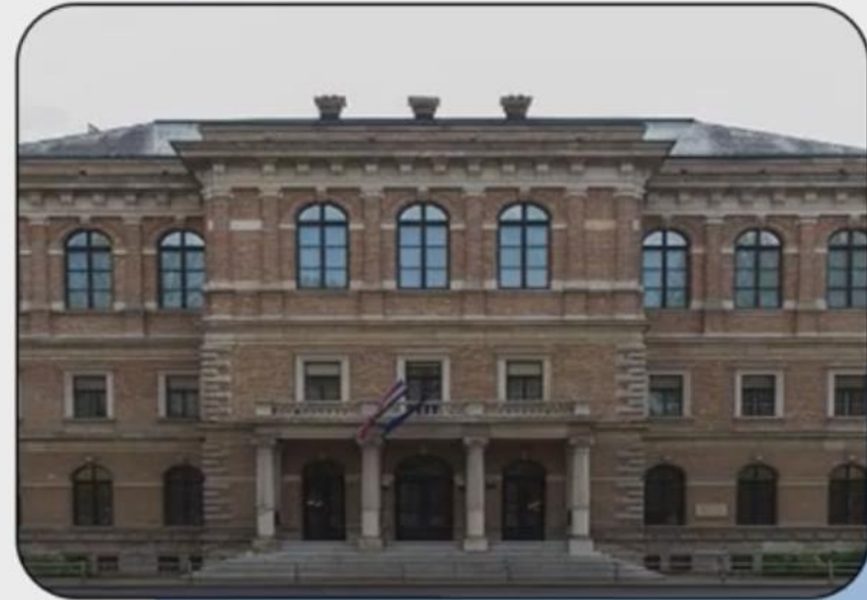
Hrvatska akademija znanosti i umjetnosti