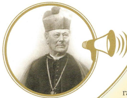
Josip Juraj Strossmayer

Rodio sam se 1815. godine u Osijeku. Hvala Bogu da me je majka znala odgojiti u pravoj razboritosti! Inače ne bih ostavio takav trag.